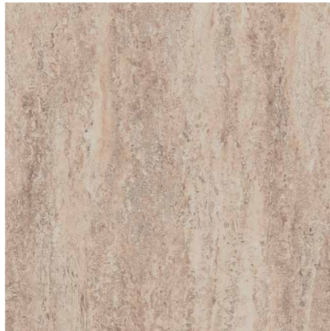
RG 04 dark beige