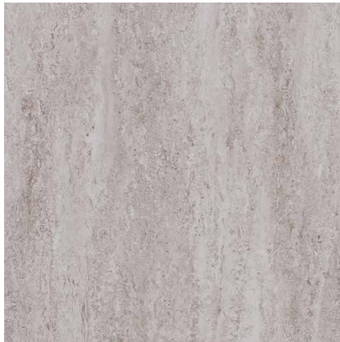
RG 03 grey