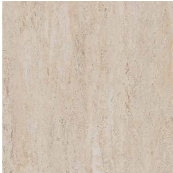
RG 02 beige