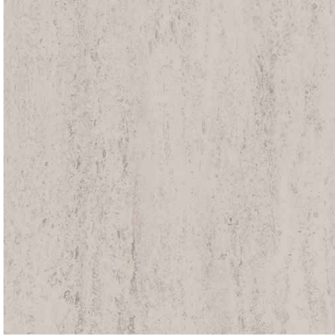
RG 01 white grey