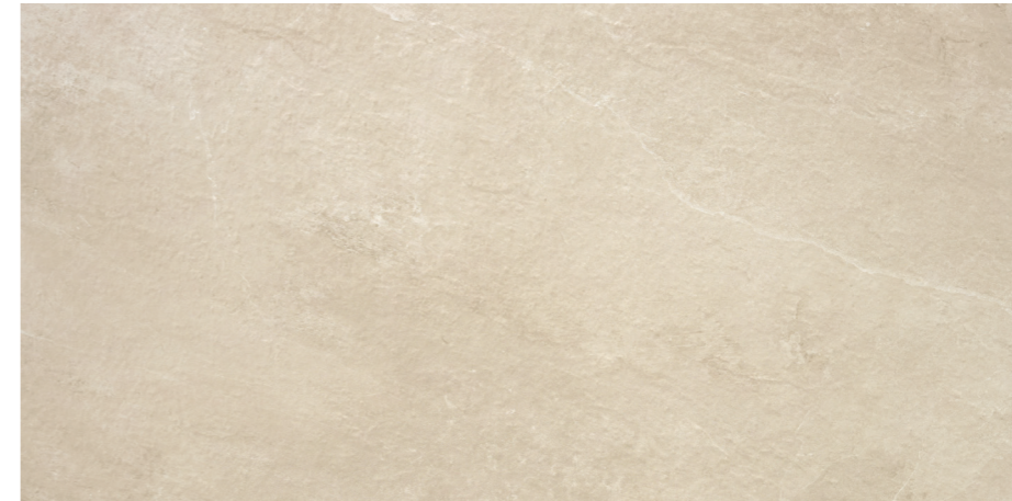
Indic Sand 60x120 R