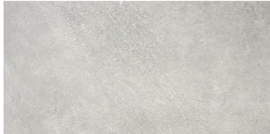
Indic Pearl 60x120 R