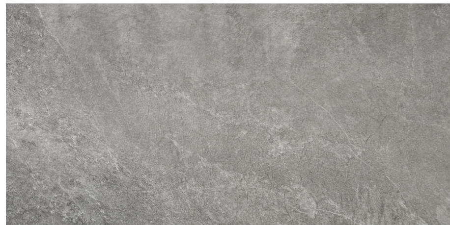
Indic Grey 60x120 R